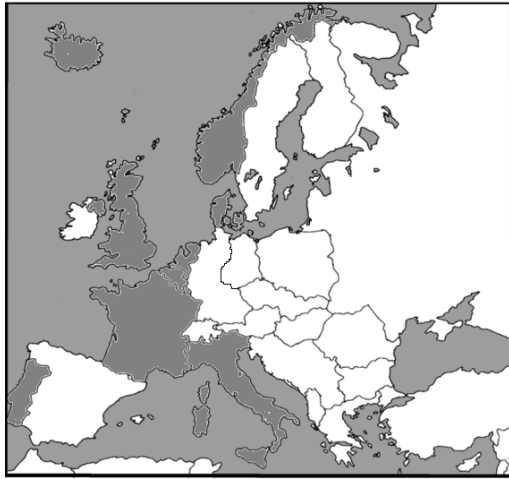
Mapa A .....

Mapy przedstawiają proces rozwoju terytorialnego NATO w Europie. Do zamieszczonych map dobierz odpowiadające im tytuły. W wyznaczone miejsca wpisz właściwe numery.